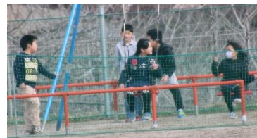
6日朝の校庭。早速遊具で遊ぶ子どもの姿

年度初日に「わくわく・どきどき」するのは子どもだけではありません。教職員も子ども以上に「わくわく・どきどき」しながら6日の紹介式と始業式、担任発表の日を迎えるのです。