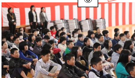
⑥ 始業式での子ども達の姿。1つ学年が進んだ喜びと自覚が伝わってきました。