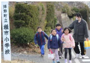
早速、各地区PTAの保護者さんの見守りが始まっています！ PTAの皆さん、ありがとうございます。