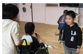
⑦ 新しい先生、友達と笑顔で元気に遊び、しっかりと掃除をする子ども達