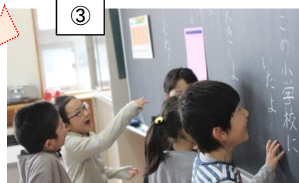
③ 黒板に書いてあるメッセージやクイズから、新担任を予想し歓声をあげる登校したての子ども達。