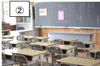
② 6日早朝のまだ誰もいない教室。今年もいろんなドラマが繰り広げられる事でしょう。