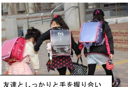
友達としっかりと手を握り合いながら、昇降口へ向かう種小っ子

風もなく穏やかな日となった4月6日、平成29年度の種市小学校がスタートしました。久しぶりに友に会ううれしさ、新しい教室や先生、教科書との新しい出会いもあり、どの子もウキウキ・ドキドキした様子で登校して来ました。スクールバスから手を振りながらあいさつをする子、自家用車を降りて元気なあいさつをする子…。今年の種小っ子も元気なあいさつがしっかりできそうです。