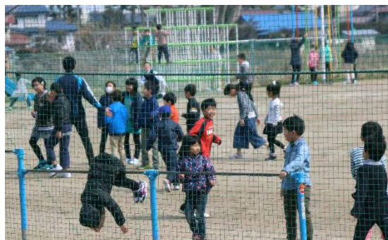
校庭では、早速子ども達の歓声が響いています。 遊べる子どもは「心と体」が健康な証拠です。