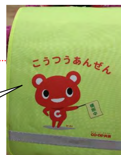
1年生のランドセルカバー