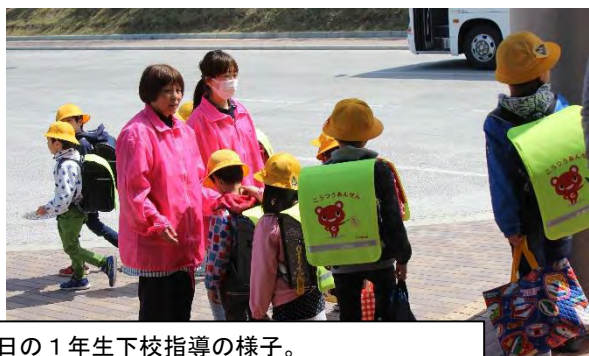
10日の1年生下校指導の様子。 1年生さんは笑顔で元気に下校していきました。