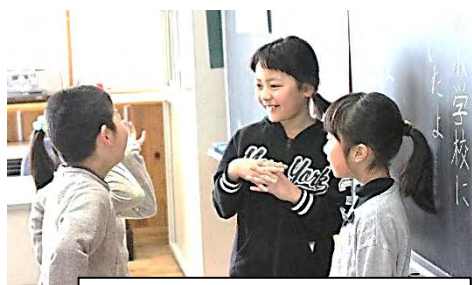
友達との久しぶりの再会に話が弾み、笑顔満開の子ども達

29年度の第1日目となった、4月6日のある教室の黒板。担任も子どもとの再会を心待ちにしていました！