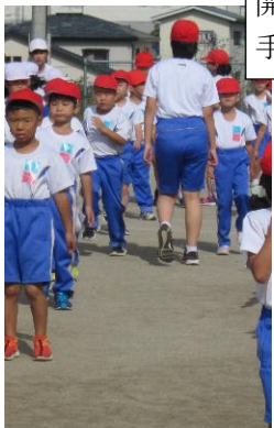
開会式で低学年の整列を手伝う児童係・誘導係