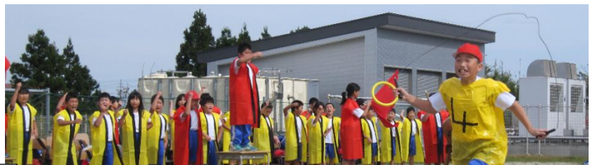
5・6年生が走っている間、応援リーダーを買って出た4年生