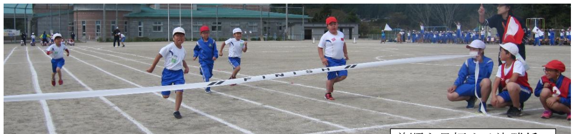
着順を見極める決勝係