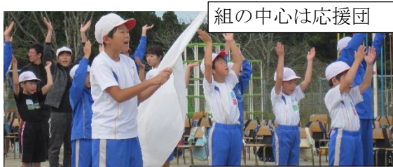
組の中心は応援団

おうちの方々も、係の子（よそのうちの子かもしれませんが）の動きにもご注目いただいて、子ども達の“ 手作りの運動会 ”を温かく見守っていただきたいと思っています。