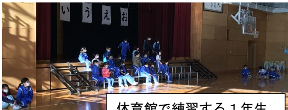
体育館で練習する1年生