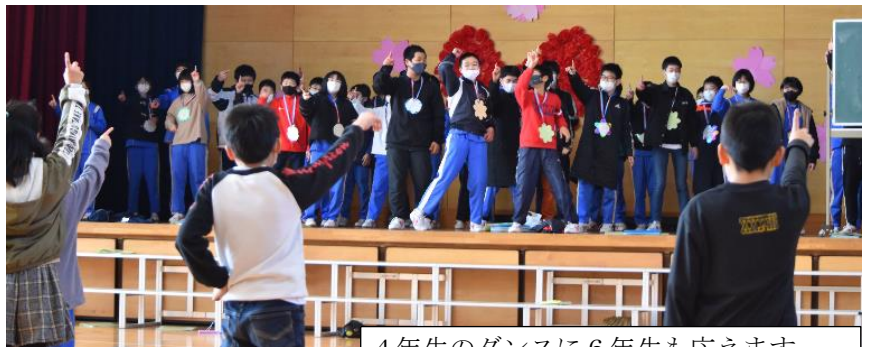
4年生のダンスに6年生も応えます