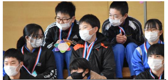
発表を見守る6年生にこやかな表情はマスクをしていてもわかります