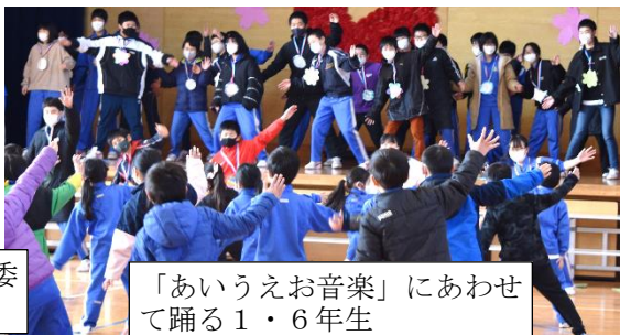
「あいうえお音楽」にあわせて踊る1・6年生