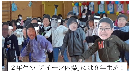
2年生の「アイーン体操」には6年生が！