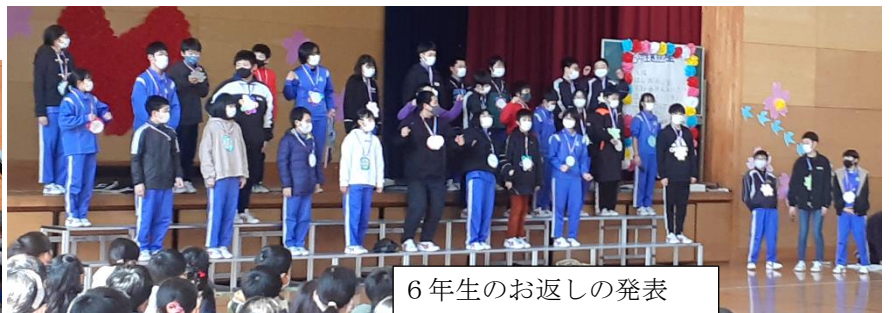
6年生のお返しの発表

6年生は、自分達がこの6年間でできるようになったことを発表しました。コロナに負けないでいろいろなことをやり遂げてきた6年生らしい発表でした。そして、6年生の発表はすべて子ども達だけで考えたというのですから、「さすが！」と思います。このあと、会は、プレゼント、児童会や縦割り班の引継ぎへと続いたのでした。