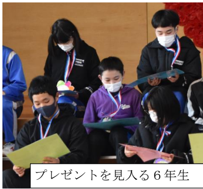
プレゼントを見入る6年生

きましたが、「ふざけ過ぎたり派手になり過ぎたりしないところ」（“あんまり”にならないところ）が心地よい楽しさになっています。楽しみ方が上手になったのだと思います。“上手”と言えば、「盛り上がったかと思うと次の発表をしっかりと聞く」という聞き方もよいと思いました。終わりに子ども達に話をしました。