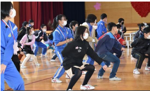
3年生は6年生と一緒に「ソーラン」