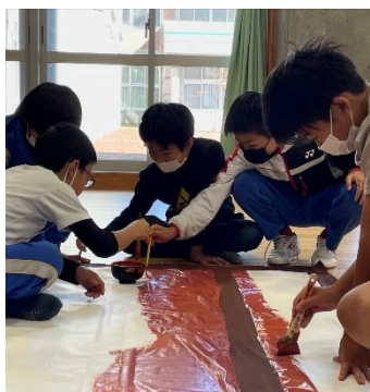
＝自分達で考え行動する＝ 自分達で練習し、自分達でバック絵を描く6年生