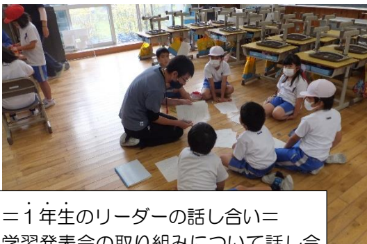
＝1年生のリーダーの話し合い＝ 学習発表会の取り組みについて話し合う学年集会の準備をしています。

また、自分の出番が終わるとキョロキョロしたり、話の筋が分からず笑うべきでないところで笑ってしまったりするような幼いところもありますが、一方で、こんな真剣な目が増えてきました。練習により、気持ちが大人になってきていることだと思っています。