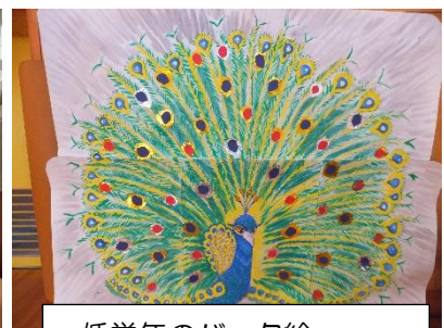
＝低学年のバック絵＝ 先生方も協力して絵をつくりました。