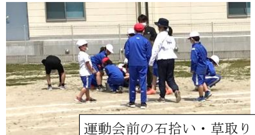
運動会前の石拾い・草取り