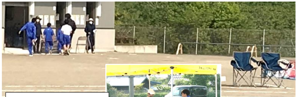
運動会当日の朝の準備